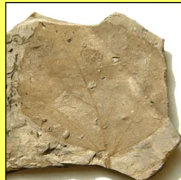
Břestovec purkynei ( Celtis purkynei ) Suchomilný a teplomilný strom mírného pásu. Miocén Horní Břízy.