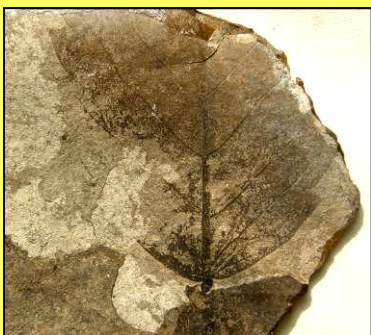
Nejda nejdolistá ( Zelkova zelkovifolia ) Strom příbuzný jilmu, dnes znám z Sicílie, Kréty a Kavkazu. Miocén Horní Břízy.

Blízký příbuzný dnešní borovice lesní. Druh byl znám podle jednoho nálezu již C. R. Purkyněmu (ČB foto). Oligocén okolí Býkova.