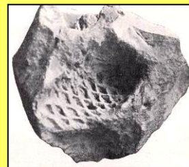
Borovice uranova ( Pinus urani )

Blízký příbuzný dnešní borovice lesní. Druh byl znám podle jednoho nálezu již C. R. Purkyněmu (ČB foto). Oligocén okolí Býkova.