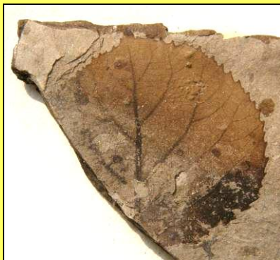
Topol topolový ( Populus populina ) Předek dvou dnešních evropských topolů. Miocén Horní Břízy