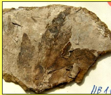
Javor trojdílný ( Acer tricuspidatum ) Nejbližší příbuzné druhy javoru jsou známé z bažin jv. části USA. Miocén Horní Břízy