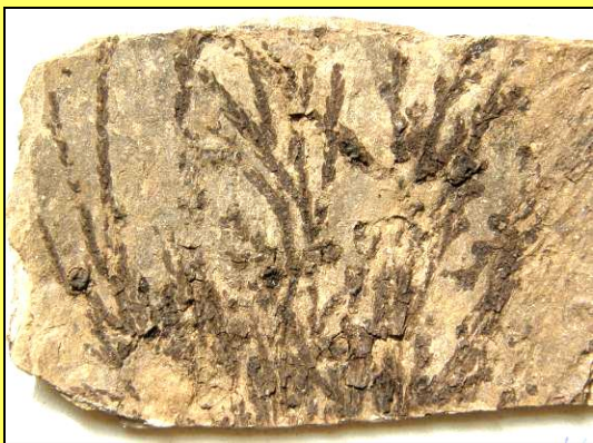
Patisovec evropský ( Glyptostrobus europaeus ) Příbuzný druh roste v bažinách tropické Číny, Miocén Horní Břízy.