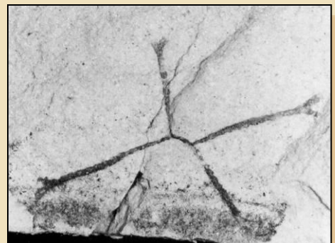
Clonograptus sp. anizograptidní graptolit