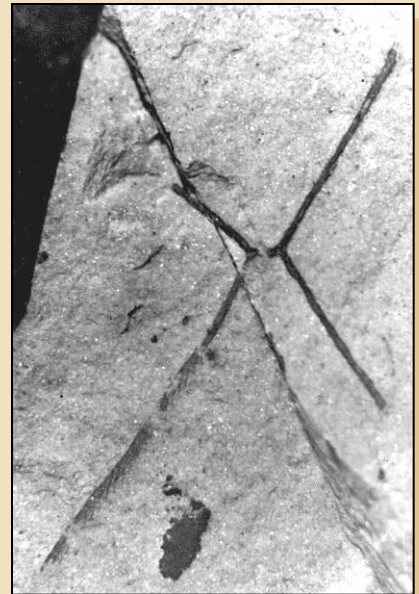
Tetragraptus sp. dichograptidní graptolit