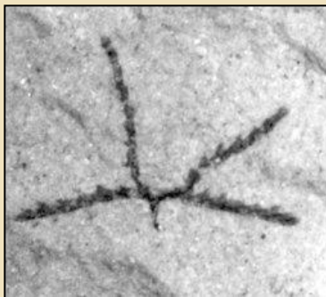
Tetragraptus sp. Dichograptidní graptolit