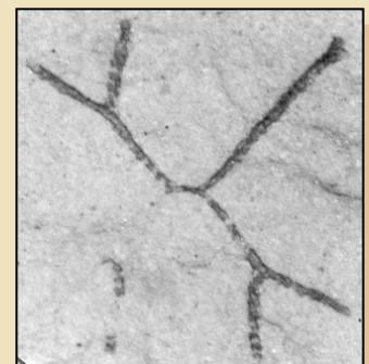
Clonograptus sp. anizograptidní graptolit