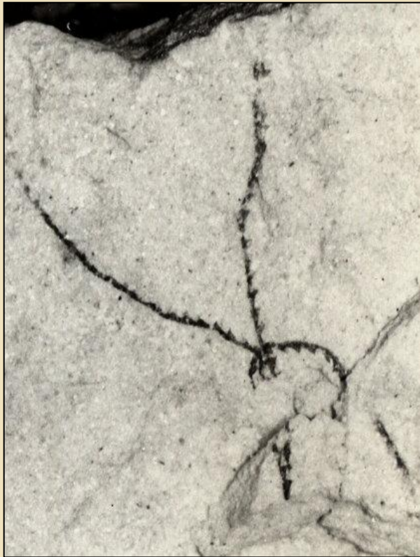
Dendrograptus mergli řídce větvený dendroidní graptolit

Dendroidní graptoliti jsou mezi graptolity z rokle v Sedleci vzácní a většinou se vyskytují jen v drobných úlomcích.