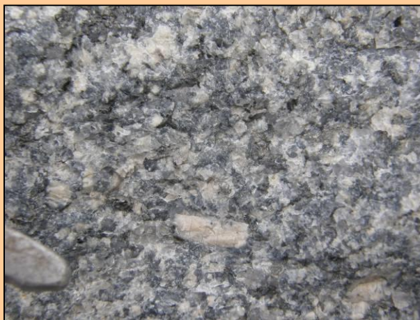
Tis u Blatna (2009)

Profil eluvia tiské žuly v lomu v Tisu u Blatna. Dobře jsou patrná odolná jádra, která po odnosu sypkého eluvia mezi nimi zůstávají na povrchu jako izolované balvany.