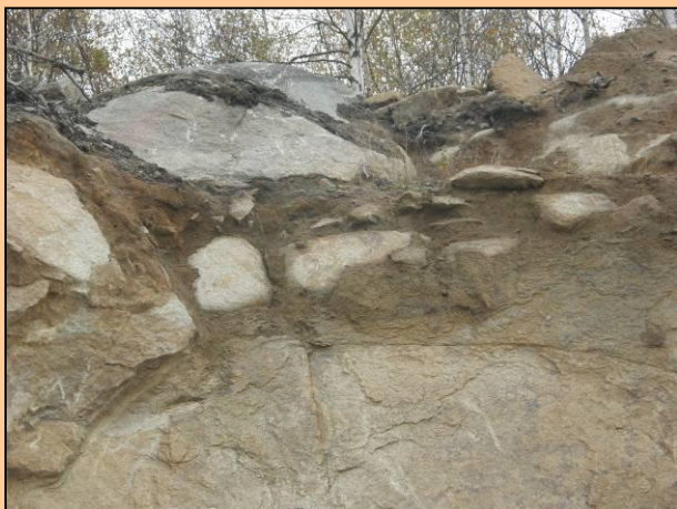
Tis u Blatna (2009)

Profil eluvia tiské žuly v lomu v Tisu u Blatna. Dobře jsou patrná odolná jádra, která po odnosu sypkého eluvia mezi nimi zůstávají na povrchu jako izolované balvany.