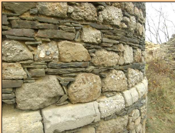
Rabštejn, hrad (2009)

Ve stěně věže je použit místní materiál prekambričských fylitů a karbonských slepenců a arkóz.