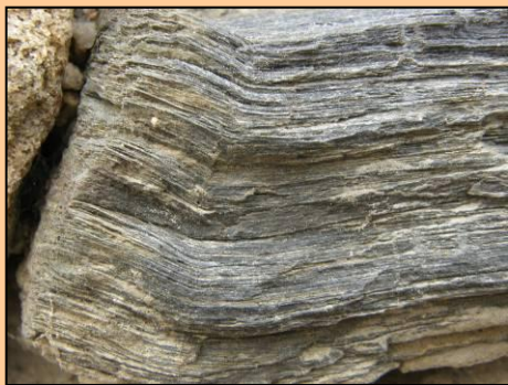
Rabštejn, hrad (2009)

Lupínkovité větrání bloku fylitu v hradní zdi.