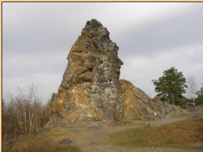
Ostrá hůrka (2009)

Celkový pohled na vypreparovaný buližníkový suk