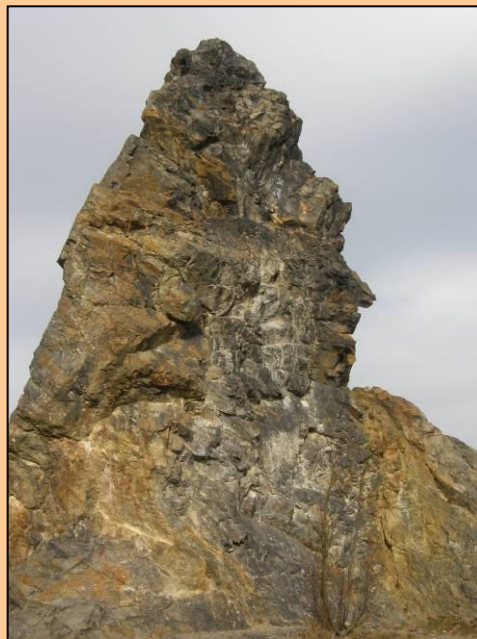
Ostrá hůrka (2009)

Celkový pohled na vypreparovaný buližníkový suk