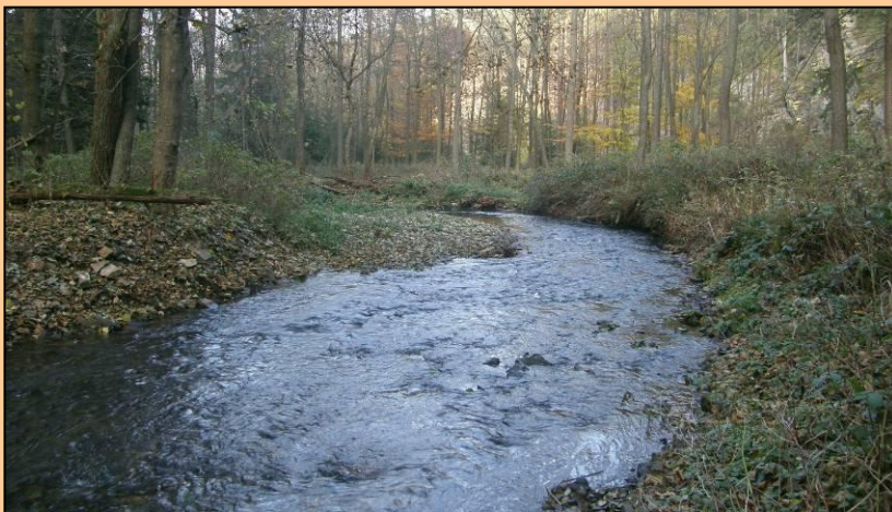
Velhartice, údolí Ostružné Výsepní a jesešní břehy meandru řeky Ostružné