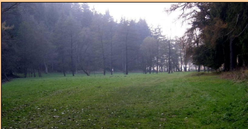
Velhartice, údolí Ostružné Plochá niva řeky na dně kaňonovitého údolí