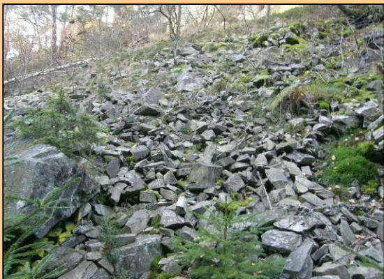
Velhartice Suťové pole z moldanubických rul